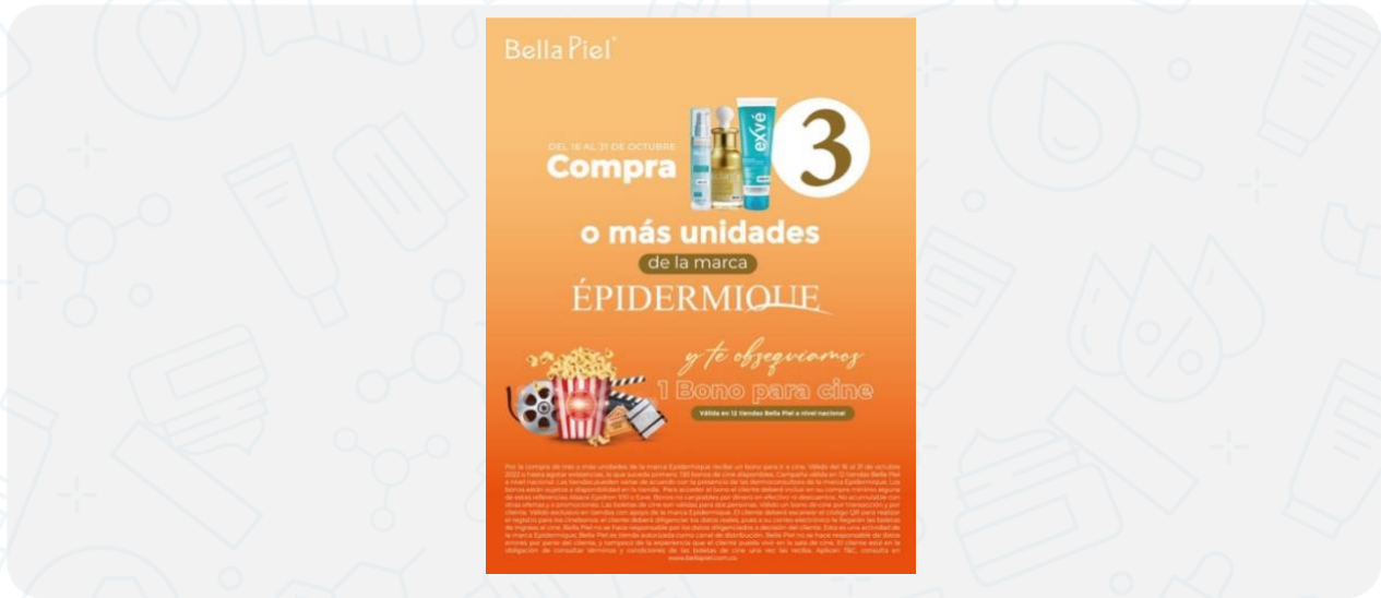
Imagen de la campaña:

Nombre de campaña: CINEBONOS EPIDERMIQUE OCTUBRE 2022