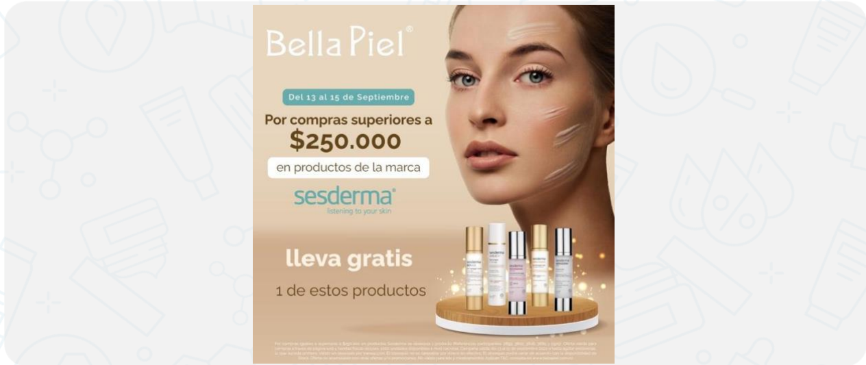
Imagen de la campaña:

Por compras iguales o superiores a $250.000 en productos Sesderma se obsequia 1 producto en textura gel (Referencias participantes: 2893, 3802, 3626, 3685 y 2905). Oferta válida para compras a través de página web, Domicilios y tiendas físicas del país. 1000 unidades disponibles a nivel nacional. Campaña válida del 1 al 15 de octubre o hasta agotar existencias, lo que suceda primero. Válido un obsequio por transacción. El obsequio no es canjeable por dinero en efectivo. El obsequio podrá variar de acuerdo con la disponibilidad de Stock. Oferta no acumulable con otras ofertas y/o promociones, No válido para kits y medicamentos. Aplican T&C, consulta en www.bellapiel.com.co