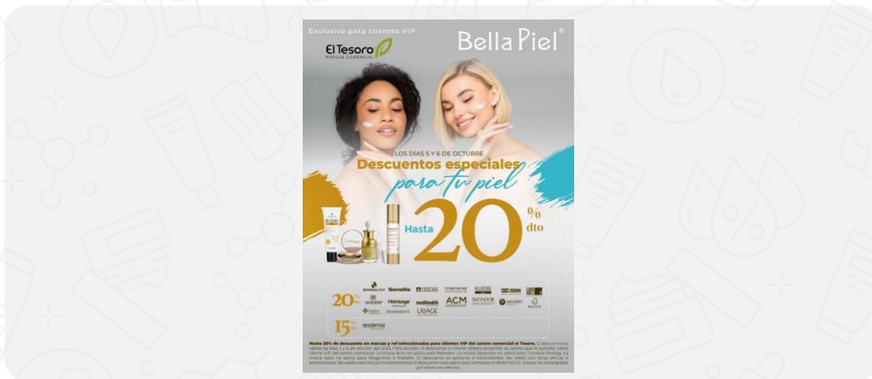
Imagen de la campaña:

Hasta 20% de descuento en marcas y ref seleccionadas para clientes VIP del centro comercial el Tesoro. El descuento es válido los días 5 y 6 de octubre del 2022. Para acceder al descuento el cliente deberá presentar su tarjeta que lo acredita como cliente VIP del centro comercial. El descuento es personal e intransferible. No válido con otras ofertas o promociones. No válido para kits y/o medicamentos. El descuento solo aplica para compras en Bella Piel CC Tesoro. No es canjeable por dinero en efectivo.