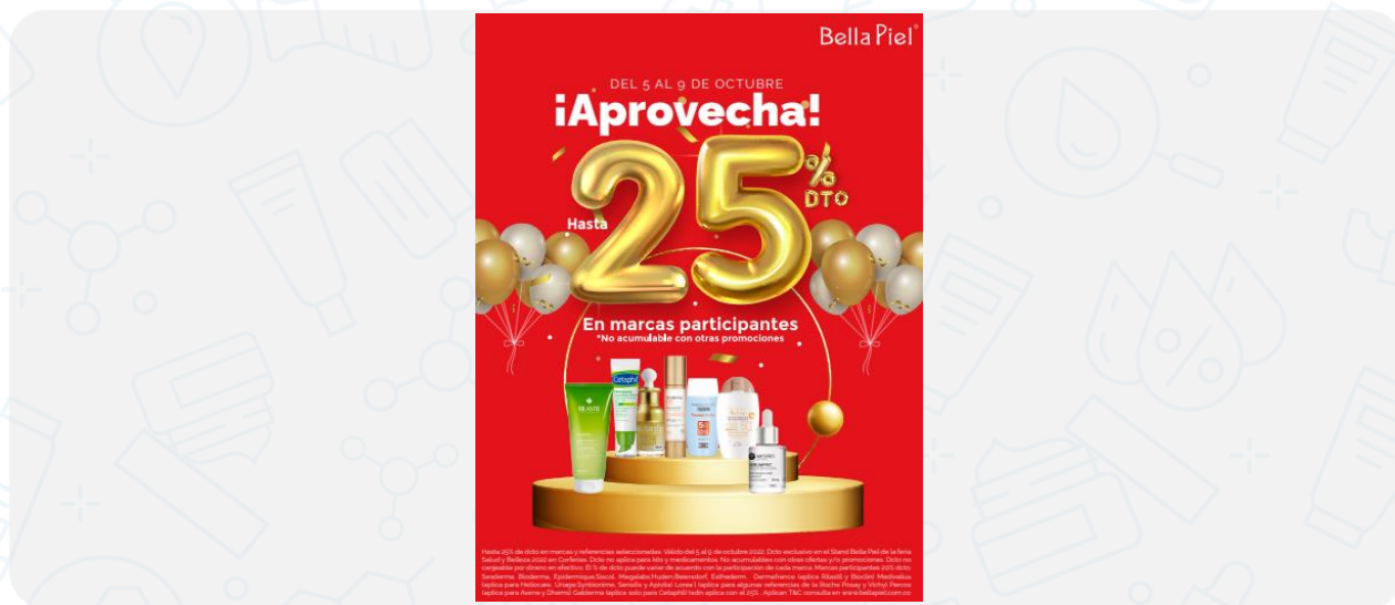
Imagen de la campaña:

Hasta 25% de dcto en marcas y referencias seleccionadas. Válido del 5 al 9 de octubre 2022. Dcto exclusivo en el Stand Bella Piel de la feria Salud y Belleza 2022 en Corferias. Dcto no aplica para kits y medicamentos. No acumulables con otras ofertas y/o promociones. Dcto no canjeable por dinero en efectivo. El % de dcto puede variar de acuerdo con la participación de cada marca. Marcas participantes 20% dcto: Sesderma, Bioderma, Epidermique, Sicol, Megalabs, Huden, Beiersdorf, Esthederm, Dermafrance (aplica Rilastil y Bioclin) Medivelius (aplica para Helioicare, Uriage, Synbionime, Sensilis y Apivita) Lorea ´l (aplica para algunas referencias de la Roche Posay y Vichy) Percos (aplica para Avene y Dhems) Galderma (aplica solo para Cetaphil) Isdin aplica con el 25%. Aplican T&C consulta en www.bellapiel.com.co