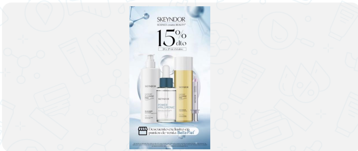
Imagen de la campaña:

15% de dcto en Skeyndor. Dcto válido los días 28 y 29 de octubre 2022. Válido para compras exclusivo en puntos de venta a nivel nacional. No aplica para compras a través de domicilios. No acumulable con otras ofertas y/o promociones. No aplica la línea de Timeless. Dcto no canjeable por dinero en efectivo. Aplican T&C consulta en www.bellapiel.com.co