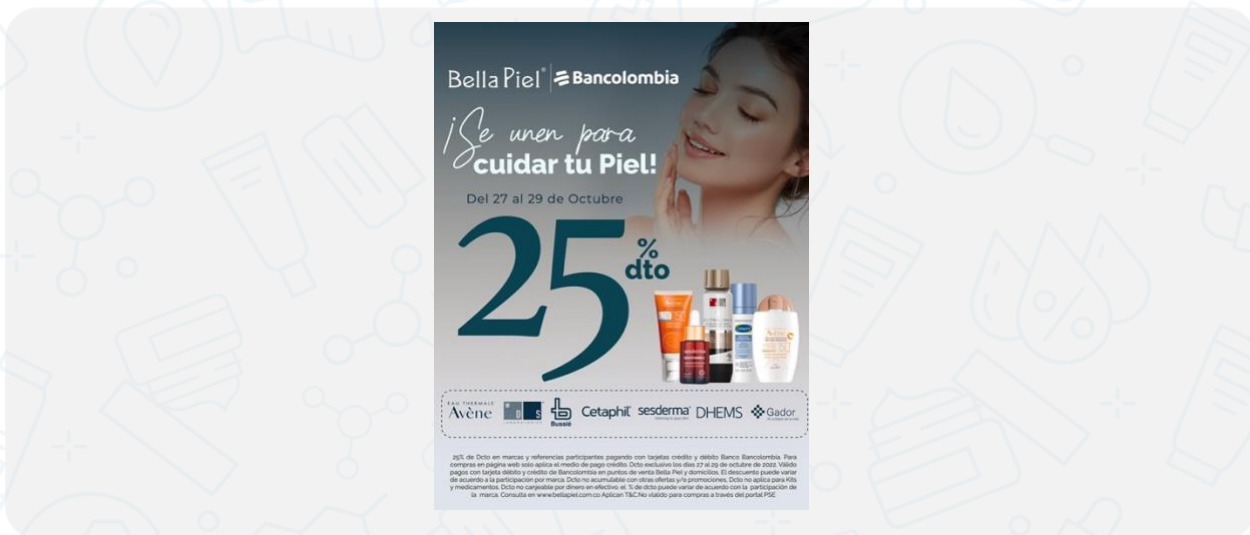
Imagen de la campaña:

Hasta 25% de Dcto en marcas y referencias participantes pagando con tarjetas crédito y débito Banco de Occidente. Para compras en página web solo aplica el medio de pago crédito. Dcto exclusivo los días 13 al 15 de octubre de 2022. Válido pagos con tarjeta débito y crédito Banco de Occidente en puntos de venta Bella Piel y domicilios. El descuento puede variar de acuerdo a la participación por marca. Dcto no acumulable con otras ofertas y/o promociones, Dcto no aplica para Kits y medicamentos. Dcto no canjeable por dinero en efectivo. Consulta % de participación por marca en www.bellapiel.com.co Aplican T&C.