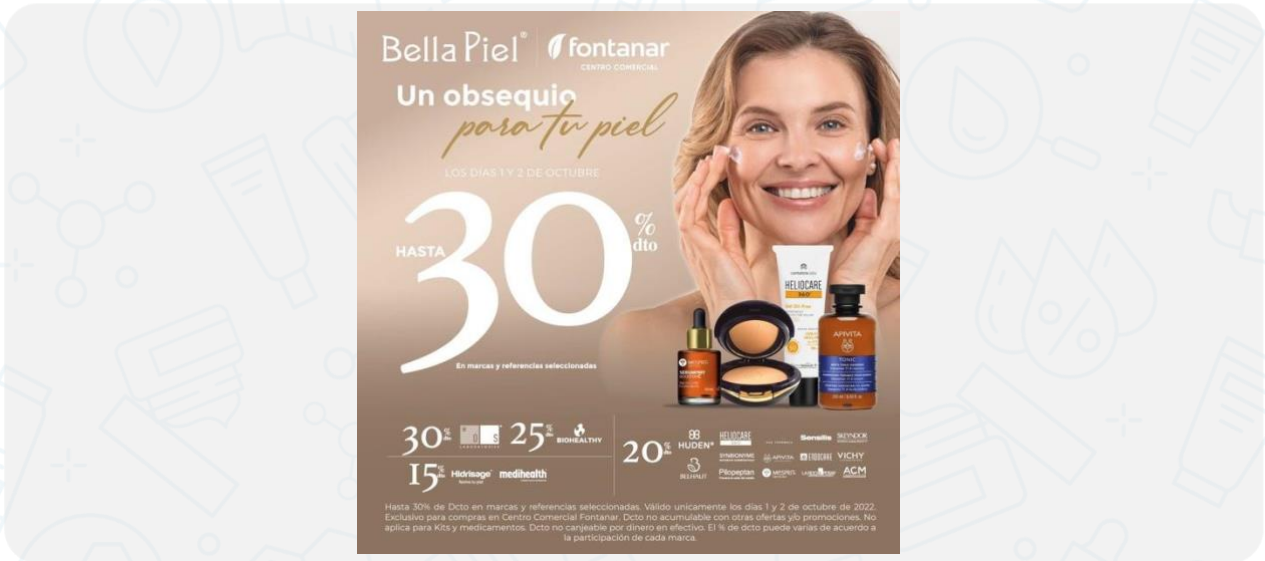
Imagen de la campaña:

Hasta 30% de Dcto en marcas y referencias seleccionadas. Válido únicamente los días 1 y 2 de octubre de 2022. Exclusivo para compras en Centro Comercial Fontanar. Dcto no acumulable con otras ofertas y/o promociones. No aplica para Kits y medicamentos. Dcto no canjeable por dinero en efectivo. El % de dcto puede varias de acuerdo a la participación de cada marca. las marca: Skin Alliance aplica con el 30% línea DS. La marca: Biohealthy aplica con el 25%. Las marcas: Huden, Mediveluis, Ecopharma (No aplica Moluskin) Mesprit (No aplica línea Timeless Prodody) Lorea 1 (aplica ref seleccionadas de la Roche Posay y Vichy) Isdin (No aplica niogermox e itraisdin) Gador y Espidermique aplican con el 20%. La marca: Hidrisage y Medihealt aplica con el 15%. Aplican T&C, Consulta en www.bellapiel.com.co