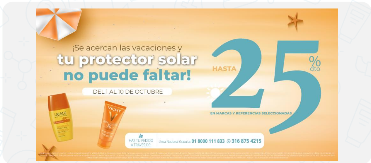
Imagen de la campaña:

Hasta 25% de Dcto en marcas y referencias seleccionadas. Válido del 1 al 10 de octubre 2022. Dcto exclusivo para compras a través de todos nuestros canales de venta. No acumulable de otras ofertas y/o promociones. No aplica para Kits y medicamentos. Dcto no acumulable con otras ofertas y/o promociones. Dcto no canjeable por dinero en efectivo. El % de dcto puede variar de acuerdo a la participación de la marca. La marca: Biohealthy (aplica solo línea Clarus) Aplica con el 25% Las marcas: Huden, Farmanexo, Ecopharma (no aplica Moluskin) Mesprit (No aplica Belhaut) Lorea 1 (solo aplica Capital soleil de Vichy) y Epidermique aplican con el 20%. Las marcas: Isdin y Medihealth e Hidrisage participan con el 15% dcto. *la marca Medivelius aplica con el 20% de dcto solo del 6 al 10 de octubre de 2022 y aplica solo con la línea Bariesun y Heliocare. Aplican T&C. Consulta en www.bellapiel.com.co