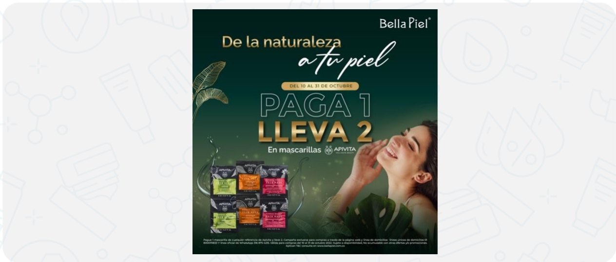
Imagen de la campaña:

Pague 1 mascarilla de cualquier referencia de Apivita y lleve 2. Campaña exclusiva para compras a través de la página web y línea de domicilios: líneas únicas de domicilios 01 8000111833 Y línea oficial de WhatsApp 316 875 4215. Válida para compras del 10 al 31 de octubre 2022.