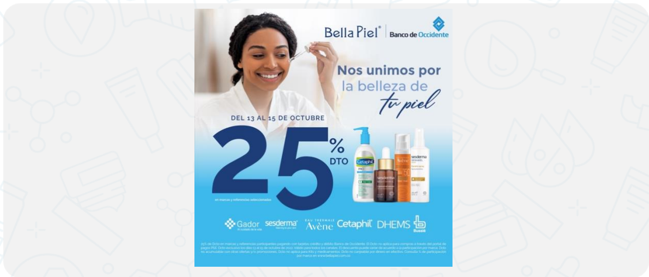
Imagen de la campaña:

Legales: Hasta 25% de Dcto en marcas y referencias participantes pagando con tarjetas crédito y débito Banco de Occidente. Para compras en página web solo aplica el medio de pago crédito. Dcto exclusivo los días 13 al 15 de octubre de 2022. Válido pagos con tarjeta débito y crédito Banco de Occidente en puntos de venta Bella Piel y domicilios. El descuento puede variar de acuerdo a la participación por marca. Dcto no acumulable con otras ofertas y/o promociones, Dcto no aplica para Kits y medicamentos. Dcto no canjeable por dinero en efectivo. Consulta % de participación por marca en www.bellapiel.com.co Aplican T&C.