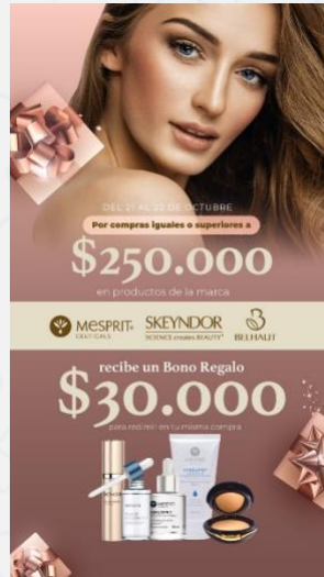
Imagen de la campaña:

Dinámica: Por compras iguales o superiores a $250.000 pesos en el laboratorio Mesprit, se obsequia al cliente un bono de 30.000 pesos para que sea redimido en la misma compra. Valido por 1 transacción, un bono por cliente. Bono válido para compras entre el 21 y 22 de octubre de 2022. Dcto exclusivo en el centro comercial: Viva y Unicentro en la ciudad de Tunja. El bono de $30.000 no es acumulable entre si. No es acumulable con otras ofertas y/o promociones. Bono no canjeable por dinero en efectivo. EL bono de $30.000 el cliente lo deberá redimir de inmediato en la misma compra. No es válido para una próxima compra. Aplican T&C, consulta en www.bellapiel.com.co Fecha: 21 y 22 de octubre