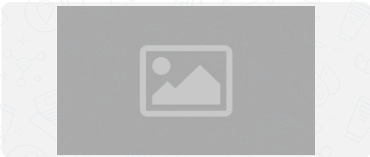
Imagen de la campaña:

20% de dcto en referencias seleccionadas de la Roche Posay y Vichy en protección solar. Dcto válido los días 20 y 21 de octubre 2022, exclusivo en la ciudad de Medellín en el evento EAFIT. Dcto no acumulable con otras ofertas y/o promociones. NO válido para Kits y medicamentos. el cliente deberá consultar las referencias participantes en www.bellapiel.com.co Aplican T&C