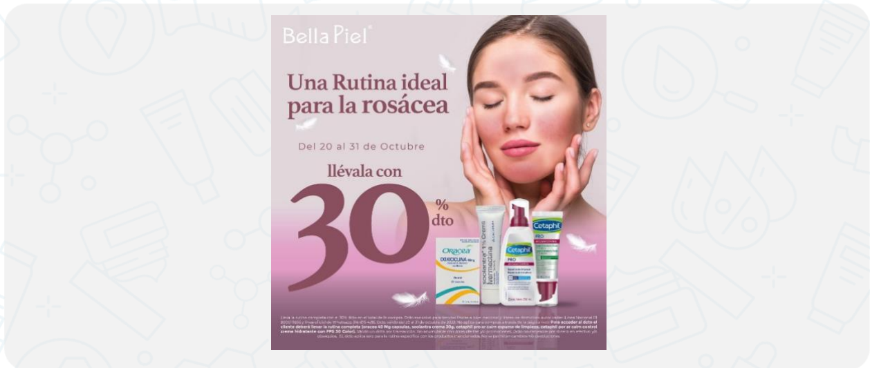
Imagen de la campaña:

Lleva la rutina completa con el 30% dcto en el total de la compra. Dcto exclusivo para tiendas físicas a nivel nacional y líneas de domicilios autorizadas: Línea Nacional 01 8000111833 y línea oficial de WhatsApp 316 875 4215. Dcto válido del 20 de octubre al 15 de noviembre 2022. No aplica para compras a través de la página web. Para acceder al dcto el cliente deberá llevar la rutina completa (oracea 40 Mg capsulas, soolantra crema 30g, cetaphil pro ar calm espuma de limpieza, cetaphil por ar calm control crema hidratante con FPS 30 Color). Válido un dcto por transacción. No acumulable con otras ofertas y/o promociones. Dcto no canjeable por dinero en efectivo y/o obsequios. EL dcto aplica solo para la rutina específica con los productos mencionados. No se permiten cambios Y/o devoluciones.