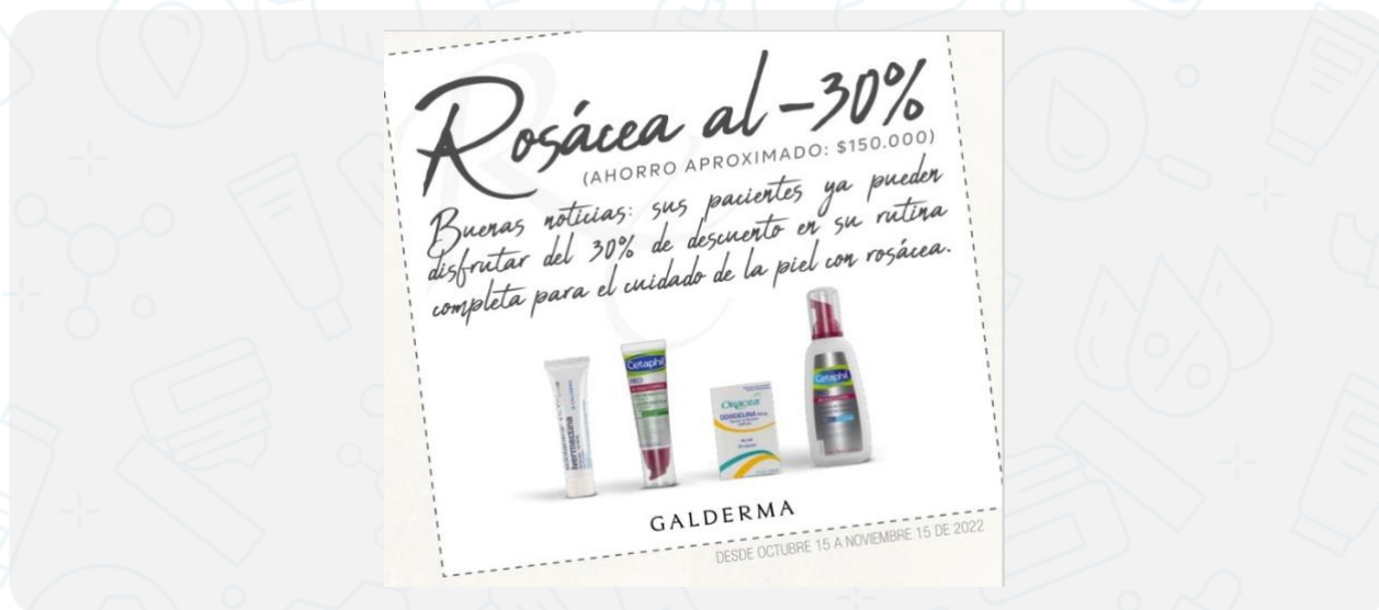
Imagen de la campaña:

Lleva la rutina completa con el 30% dcto en el total de la compra. Dcto exclusivo para tiendas físicas a nivel nacional y líneas de domicilios autorizadas: Línea Nacional 01 8000111833 y línea oficial de Whatsapp 316 875 4215. Dcto válido del 20 de octubre al 15 de noviembre 2022. No aplica para compras a través de la página web. Para acceder al dcto el cliente deberá llevar la rutina completa (oracea 40 Mg capsulas, soolantra crema 30g, cetaphil pro ar calm espuma de limpieza, cetaphil por ar calm control crema hidratante con FPS 30 Color). Válido un dcto por transacción. No acumulable con otras ofertas y/o promociones. Dcto no canjeable por dinero en efectivo y/o obsequios. EL dcto aplica solo para la rutina específica con los productos mencionados. No se permiten cambios Y/o devoluciones.