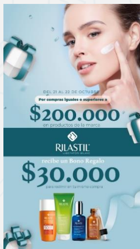
Imagen de la campaña:

Dinámica: Por compras iguales o superiores a $200.000 pesos en el laboratorio Dermafrance, se obsequia al cliente un bono de 30.000 pesos para que sea redimido en la misma compra. Valido por 1 transacción, un bono por cliente. Bono válido para compras entre el 21 y 22 de octubre de 2022. Dcto exclusivo en el centro comercial: Viva y Unicentro en la ciudad de Tunja. El bono de $30.000 no es acumulable entre sí. No es acumulable con otras ofertas y/o promociones. Bono no canjeable por dinero en efectivo. EL bono de $30.000 el cliente lo deberá redimir de inmediato en la misma compra. No es válido para una próxima compra. Aplican T&C, consulta en www.bellapiel.com.co