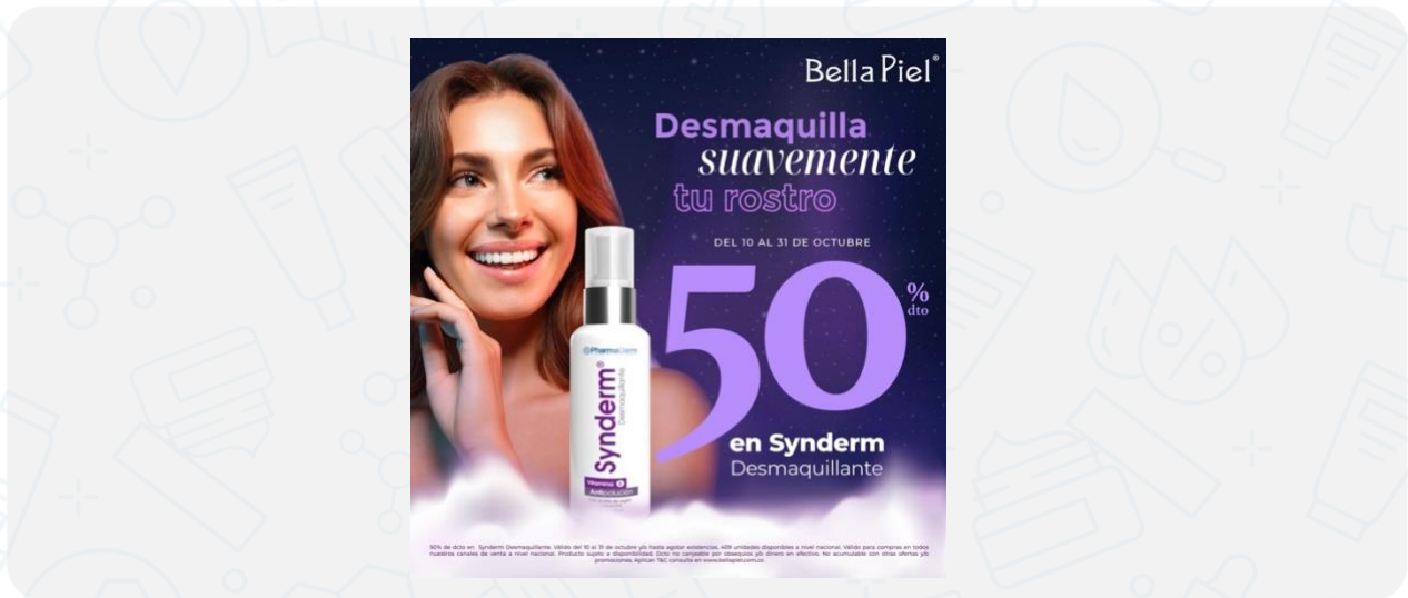
Imagen de la campaña:

50% de dcto en Synderm Desmaquillante. Válido del 10 al 31 de octubre y/o hasta agotar existencias. 409 unidades disponibles a nivel nacional. Válido para compras en todos nuestros canales de venta a nivel nacional. Producto sujeto a disponibilidad. Dcto no canjeable por obsequios y/o dinero en efectivo. No acumulable con otras ofertas y/o promociones. Aplican T&C consulta en www.bellapiel.com.co