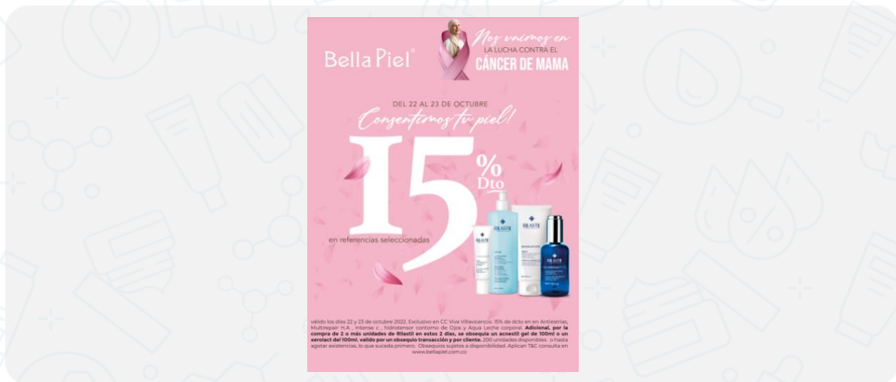
Imagen de la campaña:

Válido los días 22 y 23 de octubre 2022. Exclusivo en CC Viva Villavicencio. 15% de dcto en Antiestrías, Multirepair H.A, Intense c, hidrotensor contorno de Ojos y Aqua Leche corporal. Adicional, por la compra de 2 o más unidades de Rilastil en estos 2 días, se obsequia un acnestil gel de 100ml o un xerolact del 100ml. válido por un obsequio transacción y por cliente. 200 unidades disponibles o hasta agotar existencias, lo que suceda primero. Obsequios sujetos a disponibilidad. Aplican T&C consulta en www.bellapiel.com.co